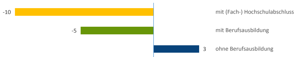
Abbildung 1: Relativer Mismatch nach Qualifikationen bis 2020 in Hessen (in %)